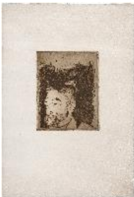
PAUL GAUGUIN (1848-1903)

ENTRE LO VISIBLE Y LO INVISIBLE Estudio, conservación y restauración en el museo