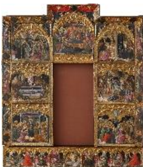
PERE NICOLAU (Valencia, documentado entre 1390 y 1408)

Retablo de los siete gozos de la Virgen María, c. 1398