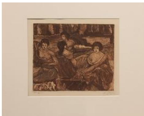
FRANCISCO ITURRINO (1864-1924)

Aguafuerte y aguatinta sobre papel Adquirido en 2020