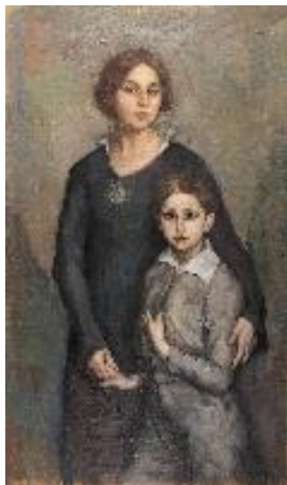
RICARD CANALS (1876-1931)