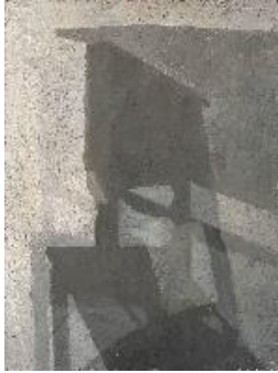
MARTA CÁRDENAS (1944) Cruce de sombras , 1969 Óleo sobre lienzo. 81 x 61 cm Adquirido en 2021