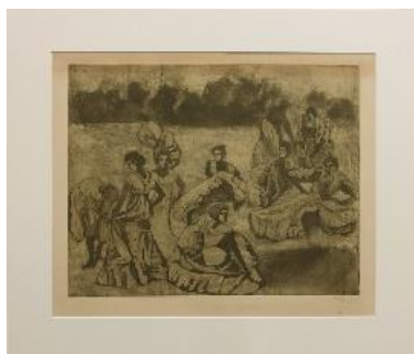
FRANCISCO ITURRINO (1864-1924)